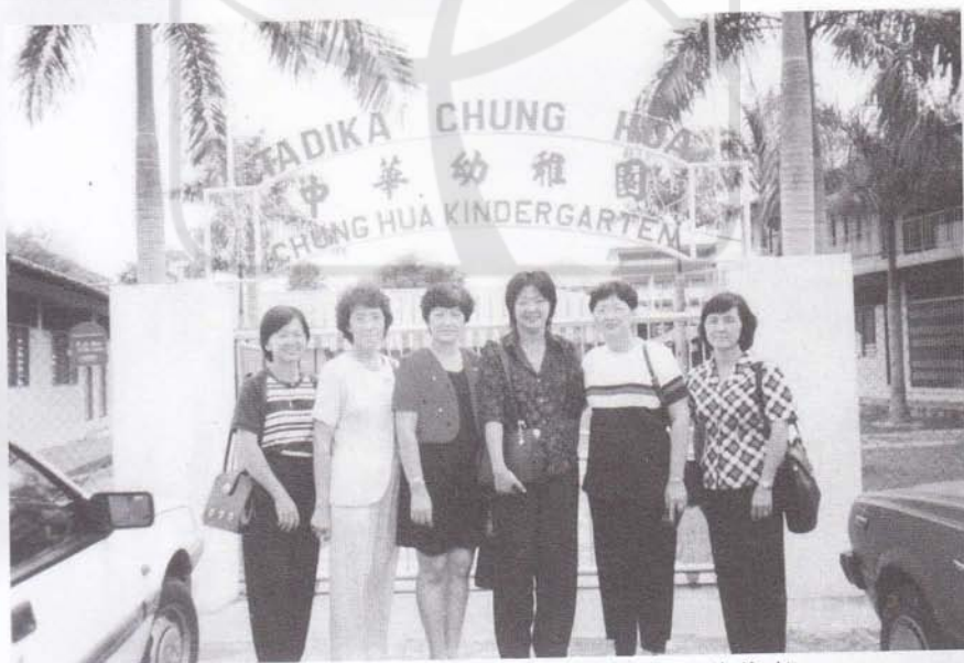
1999年11月21日拜访诗巫中华幼稚园(左三为作者)。