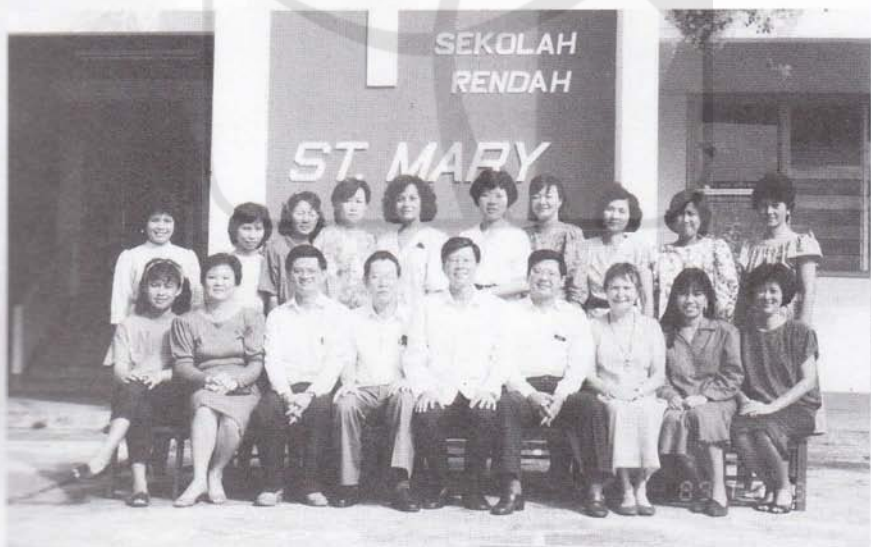
1986年至1989年參加Persatuan Tadika Malaysia (PTM) 幼教課程培訓班(后排右一為作者)