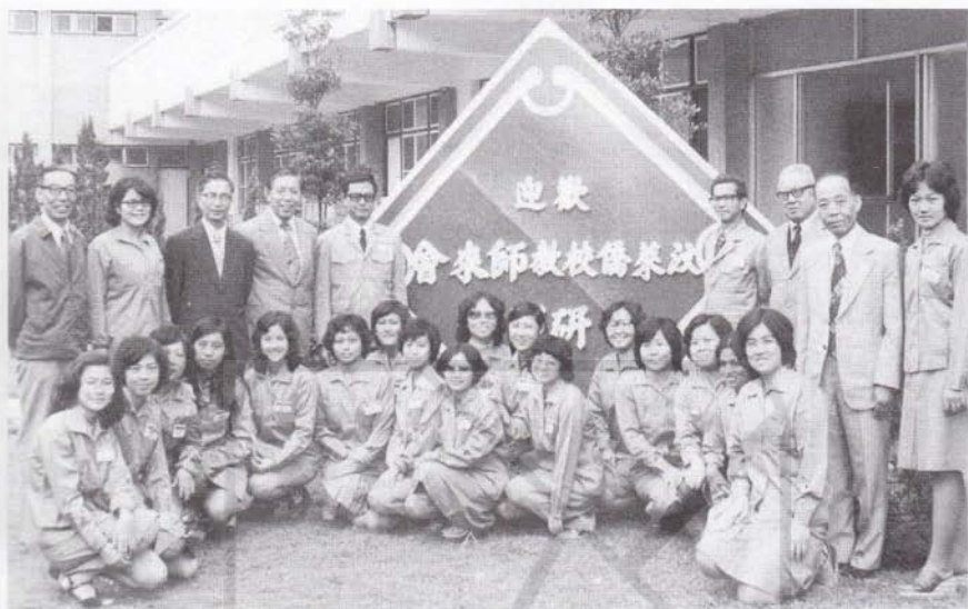
1977年5月參加台灣海外師資研習班(后排右一為作者)