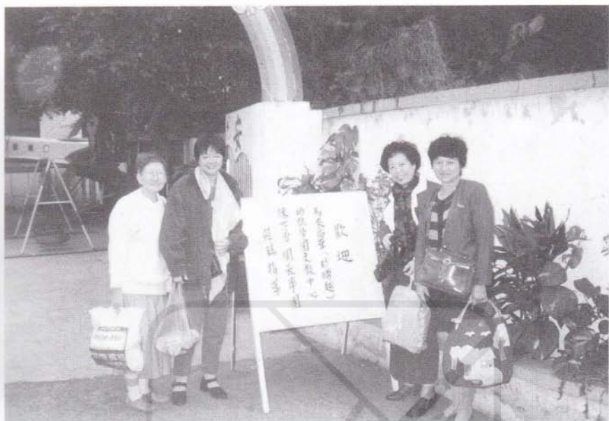
1995年12月随幼教考察团到台湾台北市幼僑幼稚园(右一为作者)