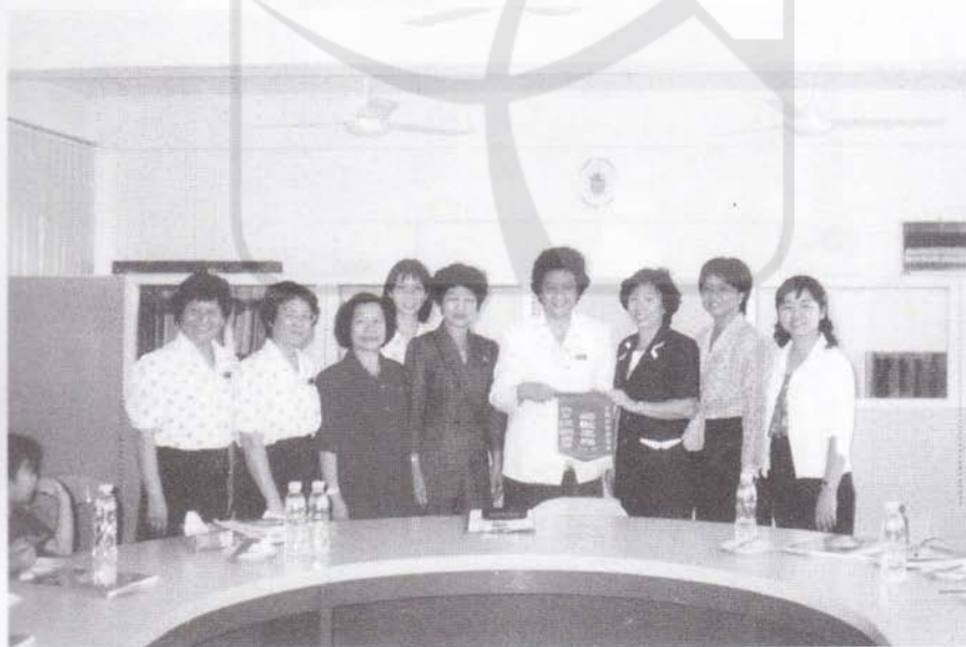
1998年6月2日到沙巴中华幼稚园(左五为作者)