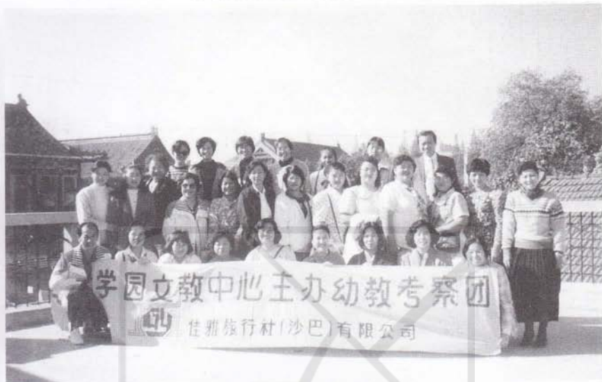
1994年到中国南京、上海幼儿园考察。(中排右二为作者)