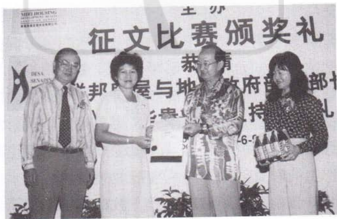
1998年6月14日摄于颁奖礼上

后记：此散文原名《幼教心得》，是一九九八年国际时报“真人真事”征文比赛得奖作品；同年七月一日刊登于国际时报。九年后重读此文，觉得走入幼教生涯廿七年，无怨无悔。