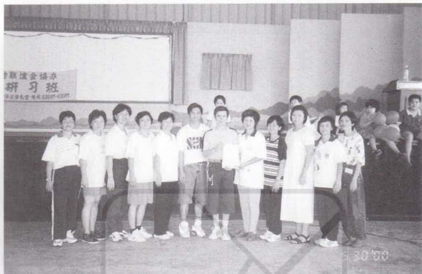
2000年5月30日廉律幼稚园全体教师合摄于由台湾导师指导之“幼儿体能研习班”结业礼上。