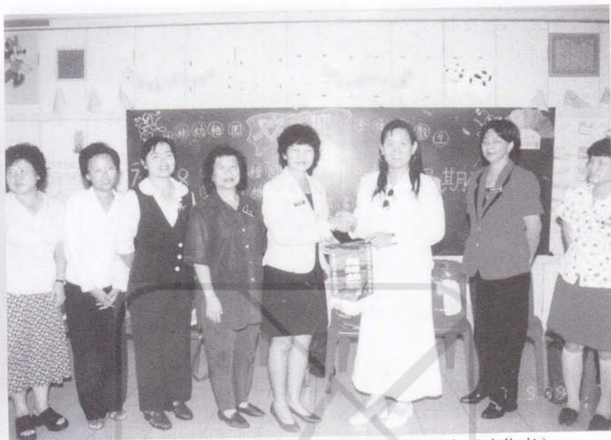
1998年9月7日到民都鲁彬彬幼稚园交流。(左五为作者)