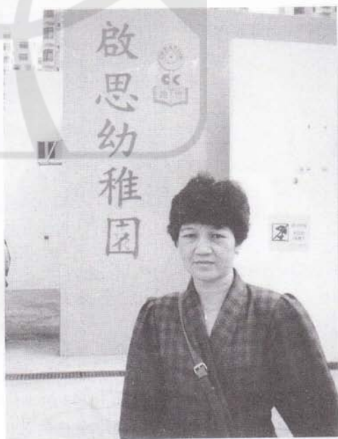
1994年11月到香港启思幼稚园考察。