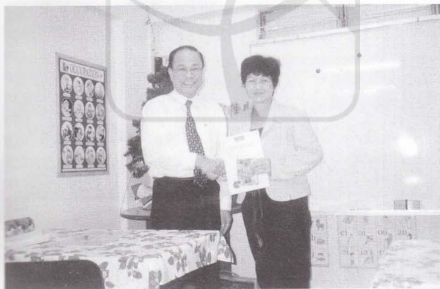
2001年11月到新加坡进行幼教考察。