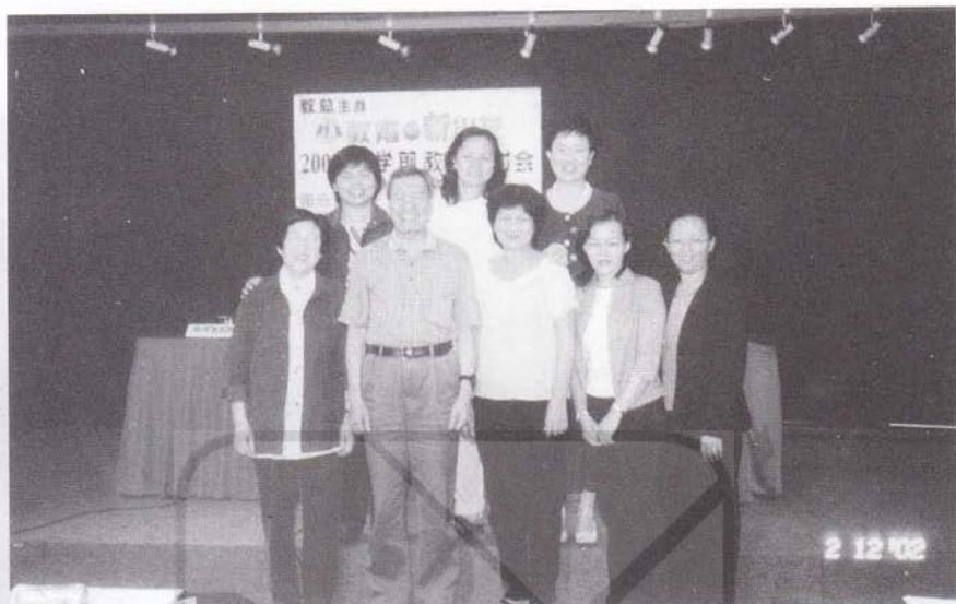
2002年12月与美里各园园长到吉隆坡参加由教总主办之“心教育·新出发”学前教育研讨会(前排右三为作者)。